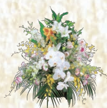
籠花20 1ヶ 22,000円(税込み)