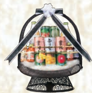
缶詰盛籠 1ヶ 13,200円(税込み)