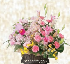
籠花15 1ヶ 16,500円(税込み)