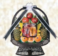
果実盛籠 1ヶ 13,200円(税込み)